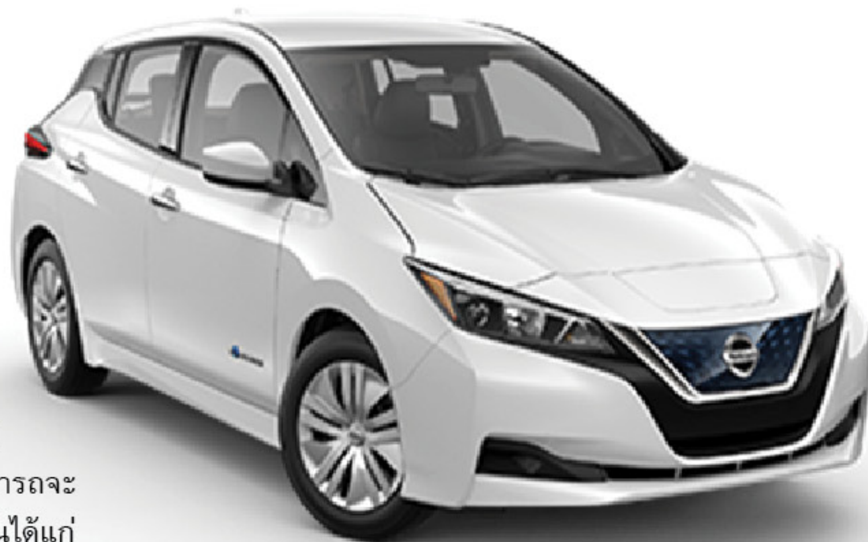
Nissan LEAF เริ่มออกจำหน่ายตั้งแต่ ปี.ค.2010

รถยนต์ขับเคลื่อนด้วยไฟฟ้า 100% หรือ รถยนต์ไฟฟ้าแบตเตอรี่ เป็นเทคโนโลยียานยนต์ที่เปลี่ยนจากต้นกำลังเครื่องยนต์ในการขับเคลื่อนหลักมาเป็นการขับเคลื่อนด้วยมอเตอร์ไฟฟ้า โดยการทดแทนการเติมเชื้อเพลิงน้ำมันด้วยการอัดประจุไฟฟ้าจากภายนอกแทนซึ่งพลังงานไฟฟ้าจะถูกเก็บไว้ในแบตเตอรี่ในตัวรถ โดยผู้ใช้รถสามารถอัดประจุไฟฟ้าจากที่พักอาศัยหรือที่ทำงานได้อย่างสะดวก ไม่ต้องพึ่งพาสถานีน้ำมันแบบเดิม ซึ่งในขณะขับเคลื่อนด้วยไฟฟ้าในตัวมอเตอร์ไฟฟ้าซึ่งมีประสิทธิภาพที่สูงกว่าจะมาแทน