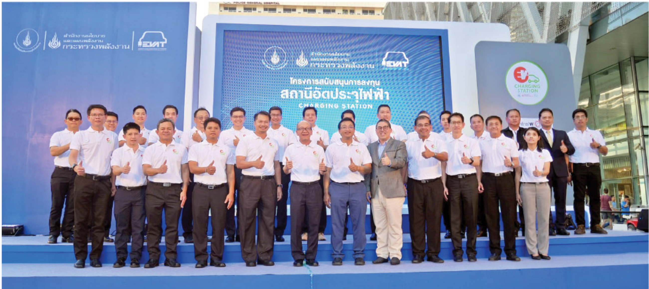
สมาคมร่วมกับภาครัฐและเอกชนในการผลักดันให้บริการสถานีอัดประจุไฟฟ้า

งานด้วยพลังงานไฟฟ้าจะต่ำกว่าการใช้เชื้อเพลิงน้ำมันก็ตาม ซึ่งจำเป็นต้องมีเงินสนับสนุนผู้ซื้อรถใหม่ ทั้งทางตรงหรือทางอ้อม