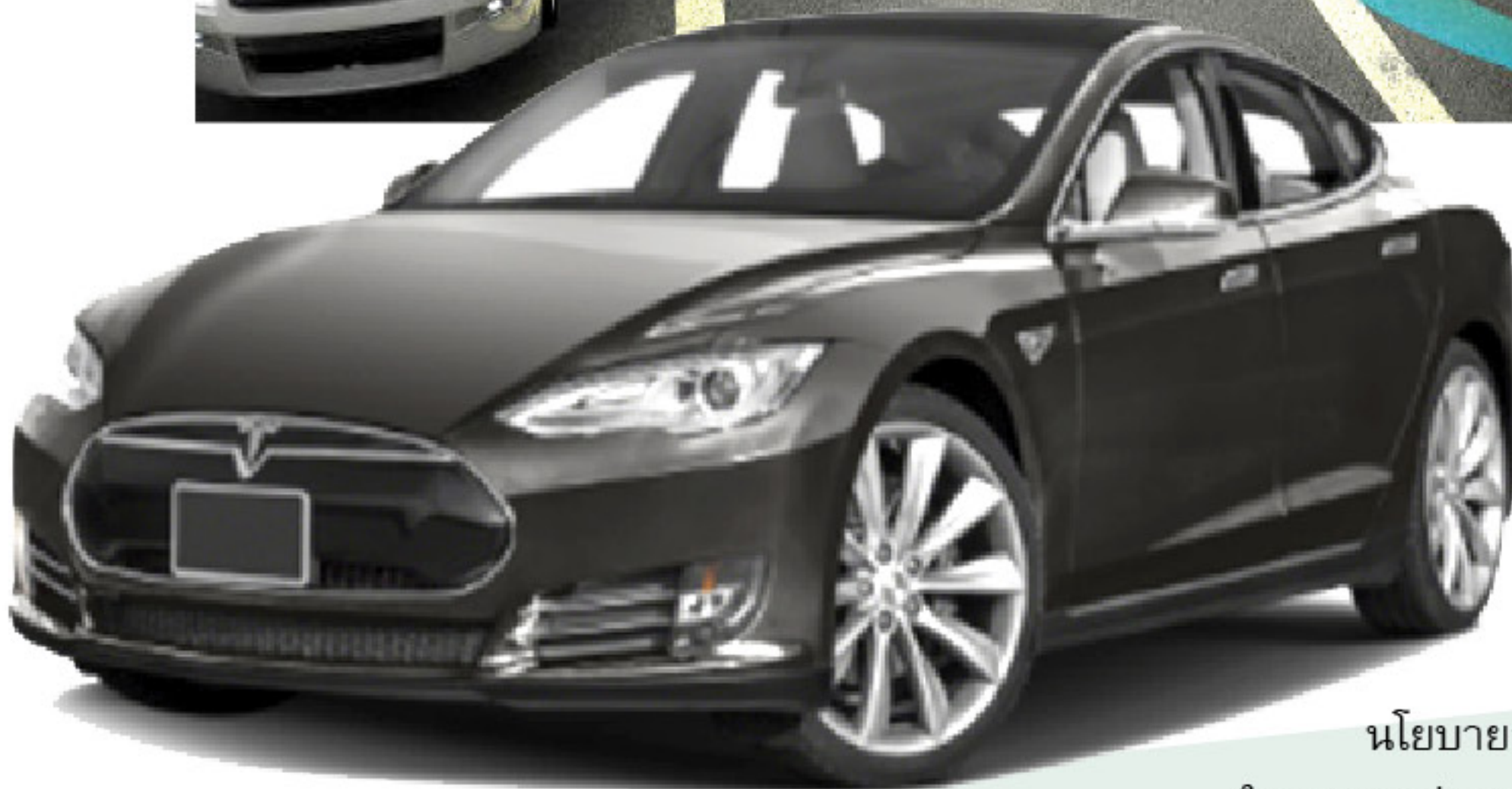
รถ Tesla Model S

Tesla ซึ่งถือว่าเป็นบริษัทรถยนต์ที่เกิดใหม่สามารถพัฒนาและจำหน่ายเฉพาะรถยนต์ไฟฟ้าอย่างเดียว โดยปัจจุบันมี 3 รุ่น ที่ออกจำหน่าย ได้แก่ Model S Model X และ Model 3 ซึ่งมีระยะทางวิ่ง 300-500 กม. ต่อการอัดประจุ 1 ครั้ง และ Tesla ยังมีการให้บริการการอัดประจุไฟฟ้าแบบเร็ว หรือ Supercharger ตามจุดสำคัญในประเทศที่มีการจำหน่ายอีกด้วย ซึ่งถือว่า Tesla เป็นบริษัทผู้นำรถยนต์ไฟฟ้าที่ทำให้หลายบริษัทต้องคอยติดตามกันอย่างใกล้ชิด สำหรับบริษัท Nissan ซึ่งเป็นหนึ่งในผู้นำรถยนต์ไฟฟ้าได้มีการนำ Nissan LEAF ออกมาจำหน่ายตั้งแต่เดือน ธ.ค. 2010 และยังมีการพัฒนารุ่นล่าสุดเป็นรุ่นที่ 2 ซึ่งมีจำหน่ายในประเทศไทยในปีนี้อีกด้วย